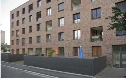
Wohngruppen Volta West