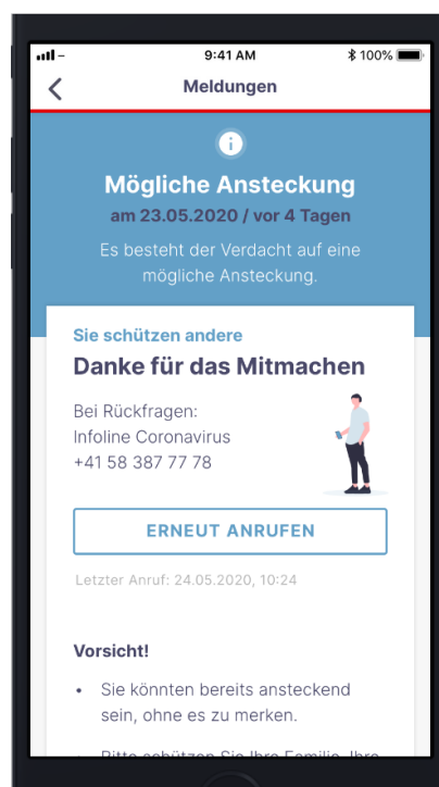
Fig. 1: raffigurazione dell'app SwissCovid di un potenziale contatto con un caso di COVID-19

Le persone che hanno avuto uno stretto contatto con un caso di COVID-19 che sono asintomatiche e che sono messe in quarantena possono anch'esse essere testate (PCR o test sierologico). L'indicazione viene effettuata dall'autorità cantonale competente (medico cantonale o dal servizio di tracciamento dei contatti da egli incaricato). I medici cantonali possono inoltre prescrivere, quando ciò sia giustificato e in deroga alle suddette prescrizioni, di fare testare delle persone asintomatiche (PCR e/o