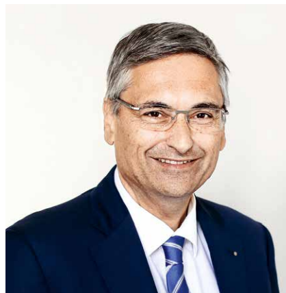
Guido Graf Regierungsrat Kanton Luzern Vorsteher des Gesundheits- und Sozialdepartementes

OdA S | Schärenmoosstrasse 77 | 8052 Zürich T 044 306 88 66 | info@oda-soziales-zuerich.ch