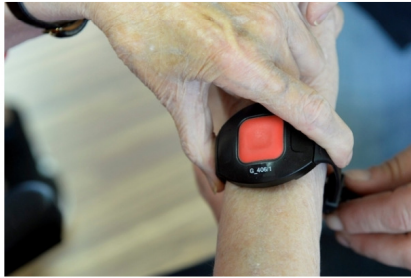
Eine Bewohnerin des Alterszentrums Adlergarten trägt den Sender der Bewohnerrufanlage.

Im vergangenen Jahr musste der Datenschützer der Stadt 64 Fälle neu bearbeiten. Unter anderem befasste er sich mit der Bewohnerrufanlage im Alterszentrum Adlergarten.